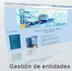
Gestión de entidades