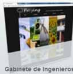
Gabinete de Ingenieros