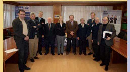
Asociación de Concesionarios de Automóviles.