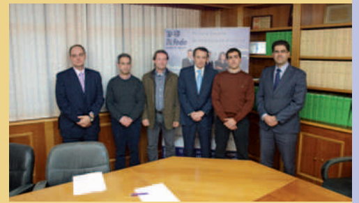
Asociación Oficinas y Despachos.