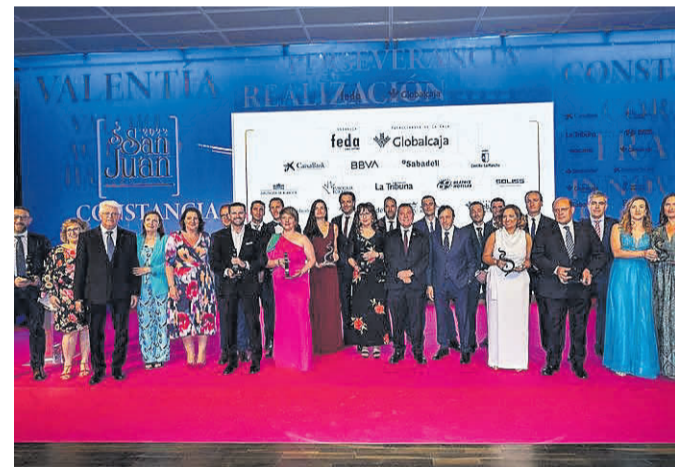
Fotografía de familia de la entrega de premios de 2022.

El jurado estará compuesto por nueve miembros, cuatro representantes del Comité Ejecutivo de FEDA, tres representantes de la Administración, un representante de la Universidad y un representante de la entidad patrocinadora del Premio respectivo.